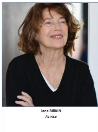
Jane BIRKIN Actrice