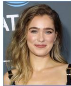
Haley LU RICHARDSON Actrice