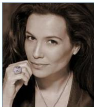
Yaël ABECASSIS Actrice