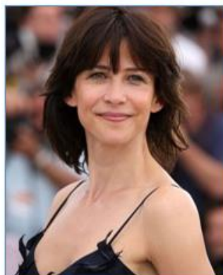
Sophie MARCEAU Actrice