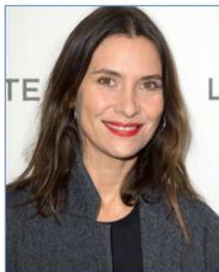
Géraldine PAILHAS Actrice