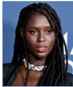
Jodie TURNER-SMITH Actrice