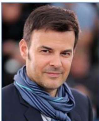
François OZON Réalisateur (France)

Des actrices Sophie MARCEAU et Géraldine PAILHAS & de l'acteur André DUSSOLLIER .