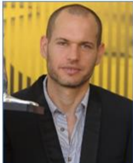
Nadav LAPID Réalisateur (Israël)