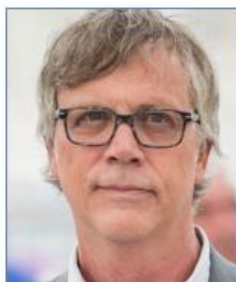
Todd HAYNES Réalisateur (Etats-Unis)