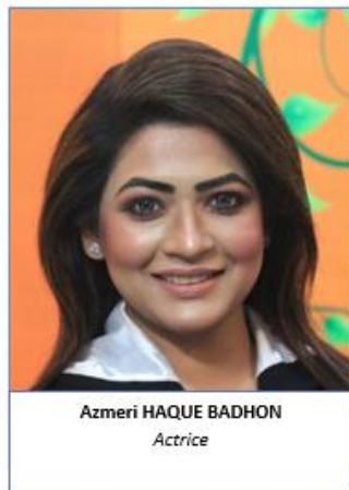
Azmeri HAQUE BADHON Actrice