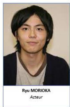
Ryu MORIOKA Acteur