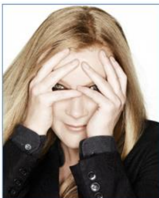
Andrea ARNOLD Réalisatrice, Scénariste (Royaume-Uni)