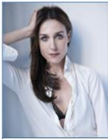
Elsa ZYLBERSTEIN Actrice (France)