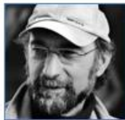
Tayfun PIRSELIMOGLU Turquie