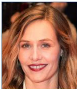
Cécile DE FRANCE Actrice