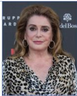
Catherine DENEUVE Actrice