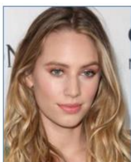
Dylan PENN Actrice