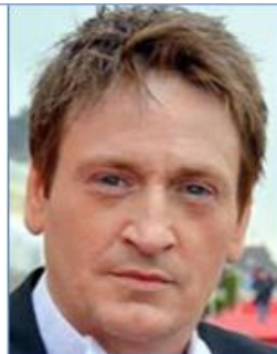
Benoit MAGIMEL Acteur