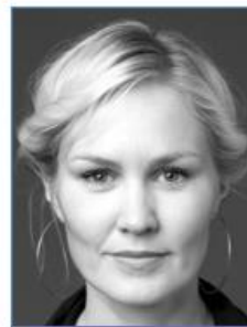
Ellen DORRIT PETERSEN Actrice