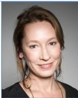
Emmanuelle BERCOT Réalisatrice (France)