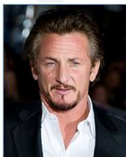
Sean PENN Réalisateur, Acteur (Etats-Unis)