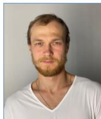
Yuriy BORISOV Acteur