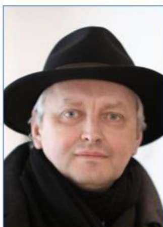
Sergei LOZNITSA Réalisateur (Ukraine)