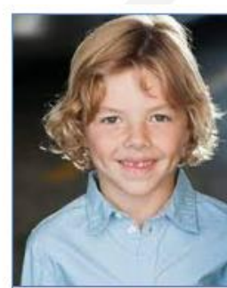
Beckam CRAWFORD Acteur