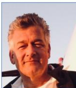
Joseph VITARELLI Compositeur