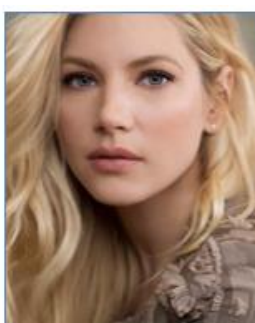
Katheryn WINNICK Actrice