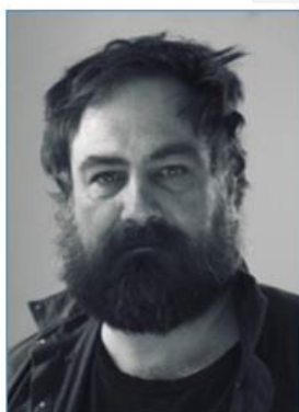
Justin KURZEL Réalisateur (Australie)