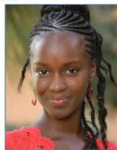
Fatou N'DIAYE Actrice