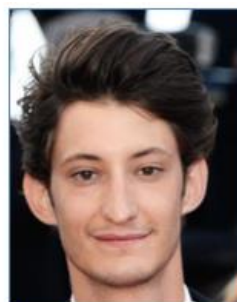
Pierre NINEY Acteur