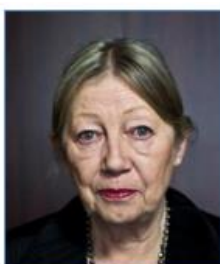
Françoise LEBRUN Actrice