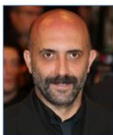
Gaspar NOE Réalisateur (France)