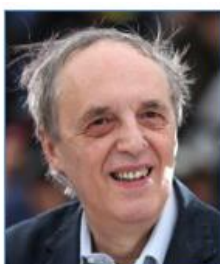
Dario ARGENTO Acteur