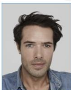
Nicolas BEDOS Réalisateur (France)