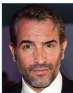
Jean DUJARDIN Acteur