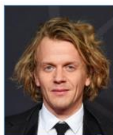
Alex LUTZ Acteur