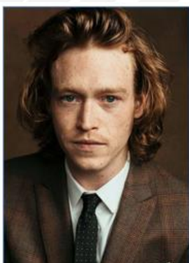
Caleb Landry JONES Acteur