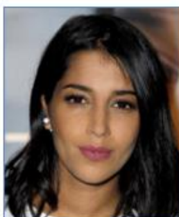
Leïla BEKHTI Actrice