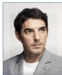
Damien BONNARD Acteur